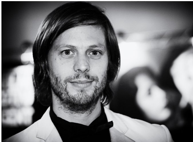
Felix van Groeningen

Van Groeningen wurde 1977 in Gent, Flandern (Belgien) geboren und wurde mit seinem dritten Film „Die Beschissenheit der Dinge“ international bekannt: