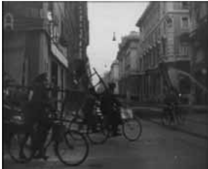
On Musik: Ziehharmonika