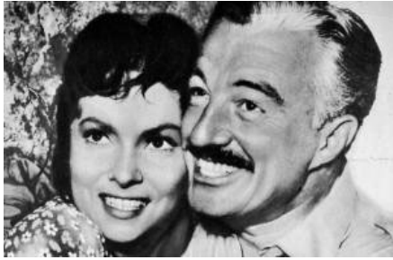
Vittorio de Sica mit Gina Lollobrigida