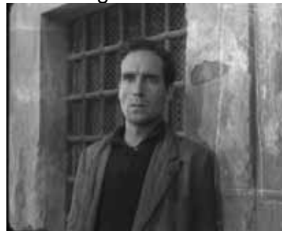
Stimmung: Der Dieb